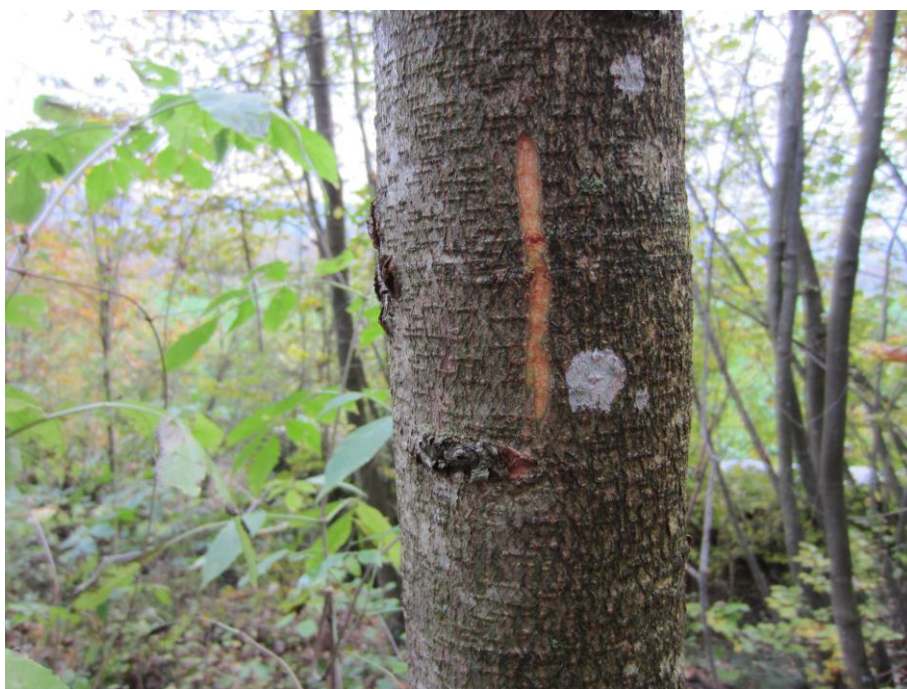
Elsbeere ( Sorbus torminalis ) n°2