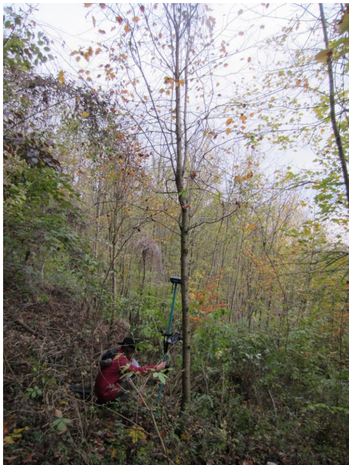
Elsbeere ( Sorbus torminalis ) n°2