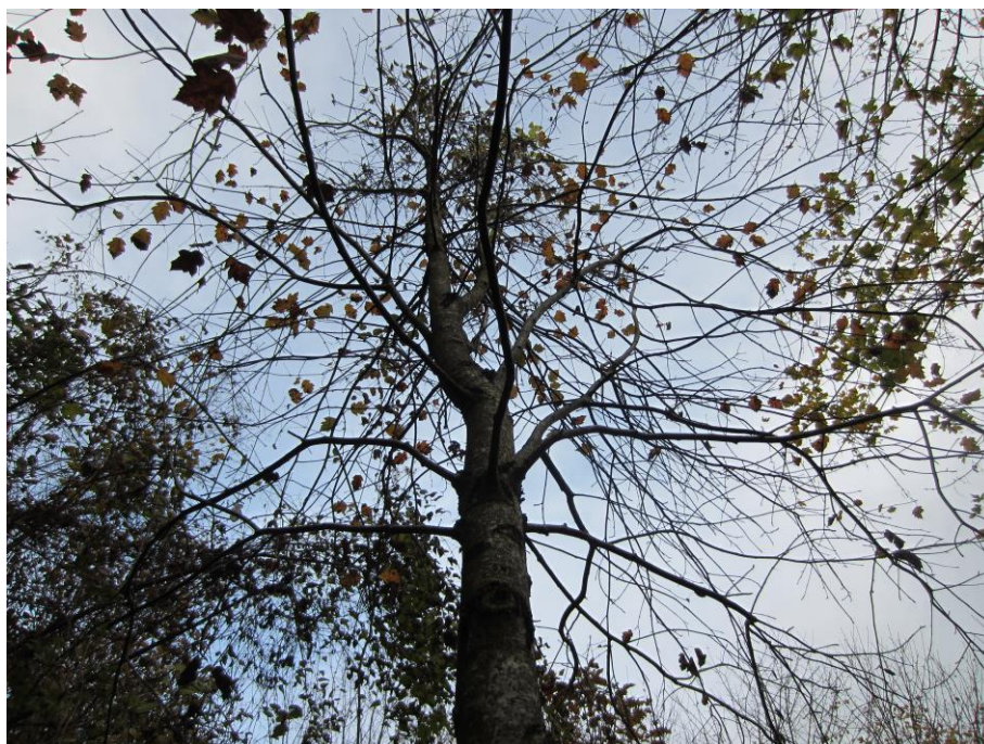
Elsbeere ( Sorbus torminalis ) n°2